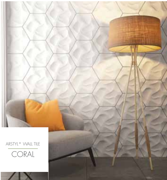
ARSTYL® WALL TILE CORAL