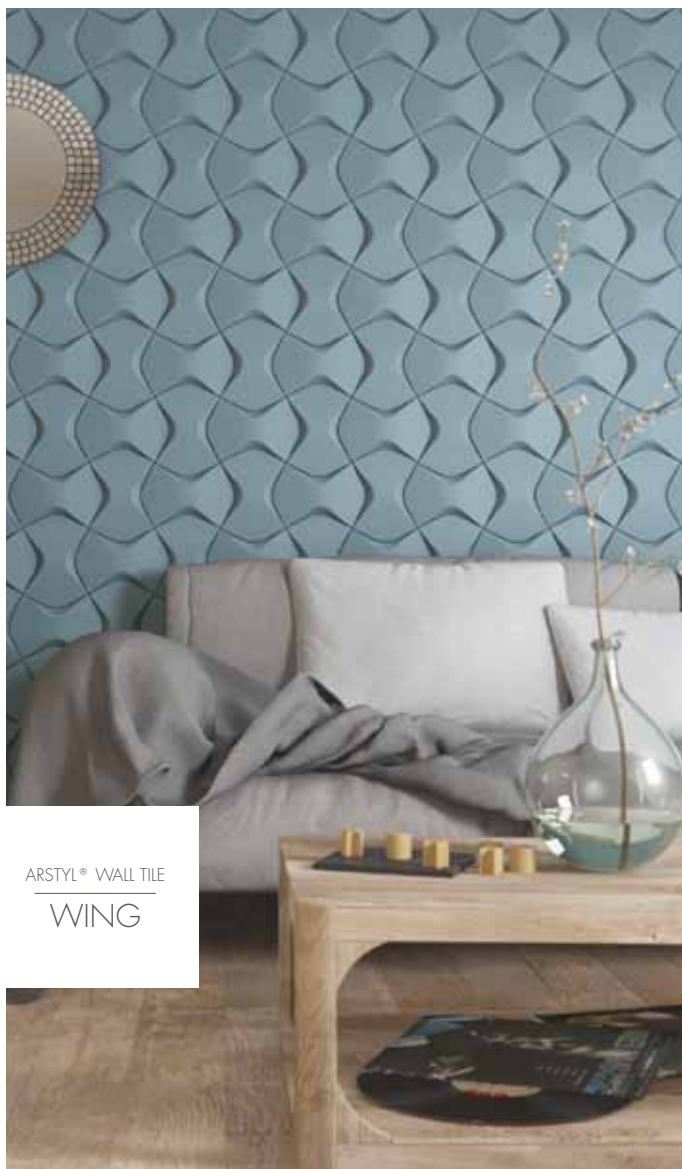
ARSTYL® WALL TILE WING