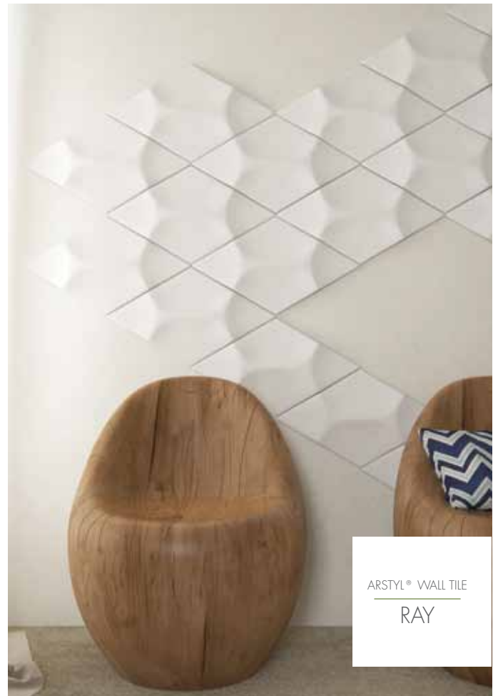
ARSTYL® WALL TILE RAY