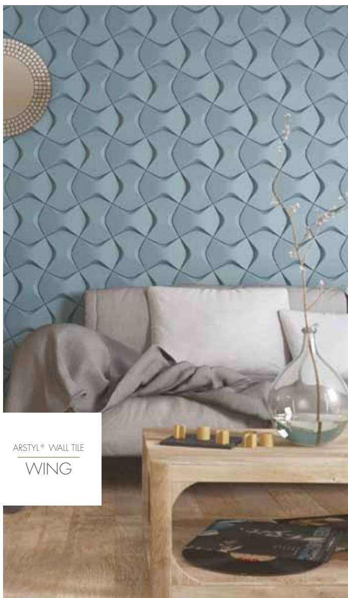
ARSTYL® WALL TILE WING