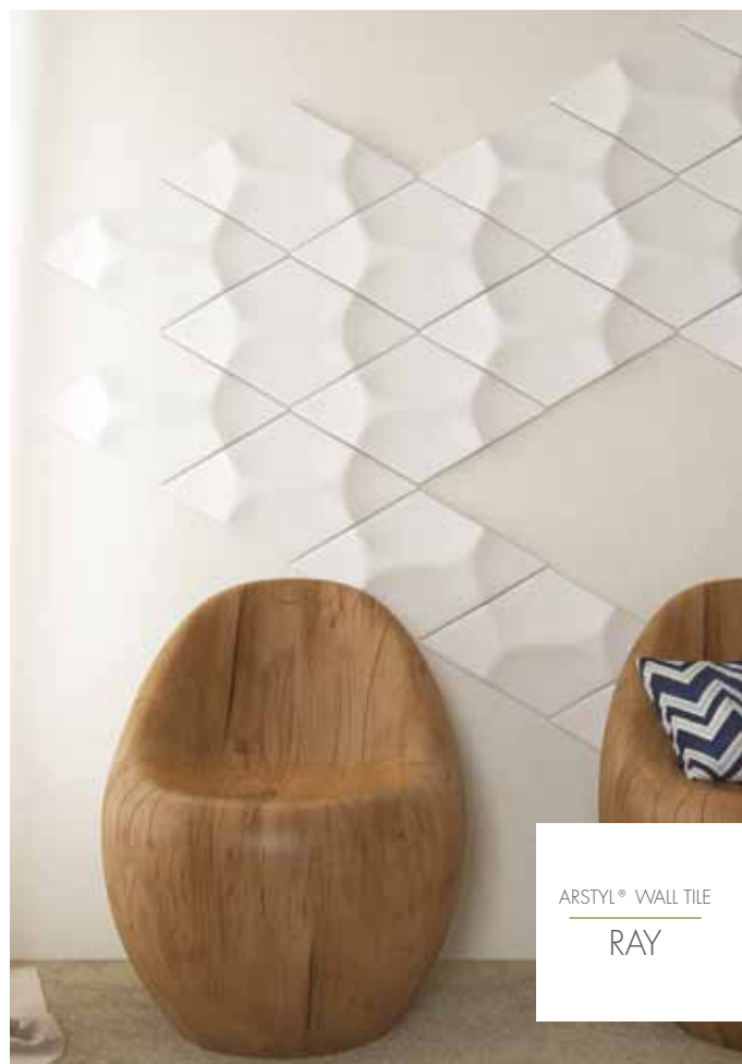
ARSTYL® WALL TILE RAY