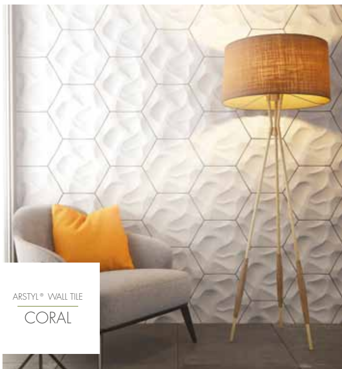
ARSTYL® WALL TILE CORAL